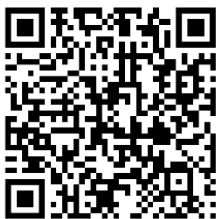
QR-Code für Informationsabend

Wir wünschen Ihnen ein erholsames Weihnachtsfest und einen guten Rutsch ins neue Jahr. Bleiben Sie gesund.