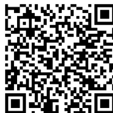
QR-Code für Hospitationstag